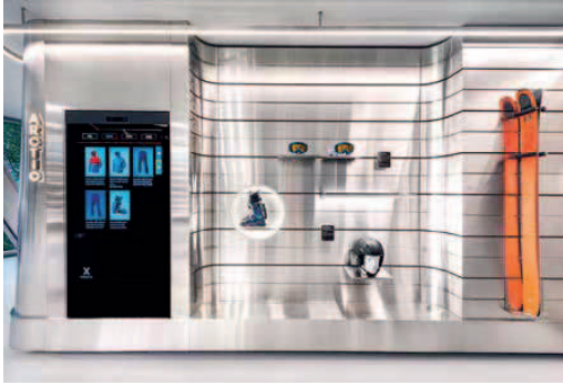
Wintersport gibt's auch: die Snowboard-Präsentation