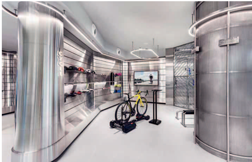
Blick in die Fahrradabteilung