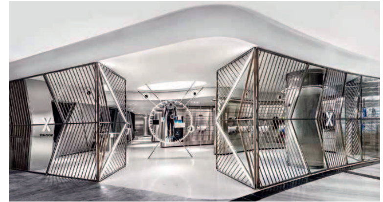
Sport und Technik 4.0