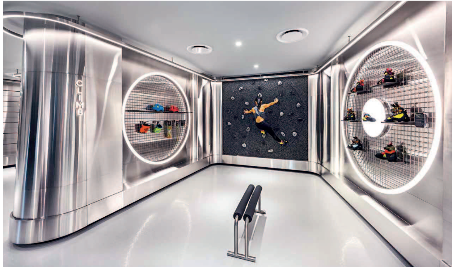
Free Climbing: Die Filiale verfügt auch über eine Boulder-Wand.