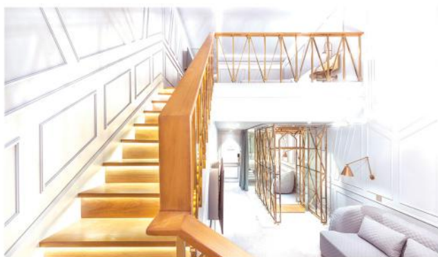
客房的室内装潢以白色、灰色和香槟铜色做搭配，彰显时尚高贵的华丽感。