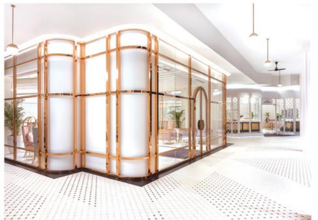
黑白相间的点状地板图案“消失又浮现”，并将大厅与其他底楼空间统一起来。

A 根据檳城的城市规划指南，新建建筑必须与周边丰富的历史背景融为一体，以提升其传统元素与细节。此外，我们也利用当地的气候优势，试图为酒店室内全