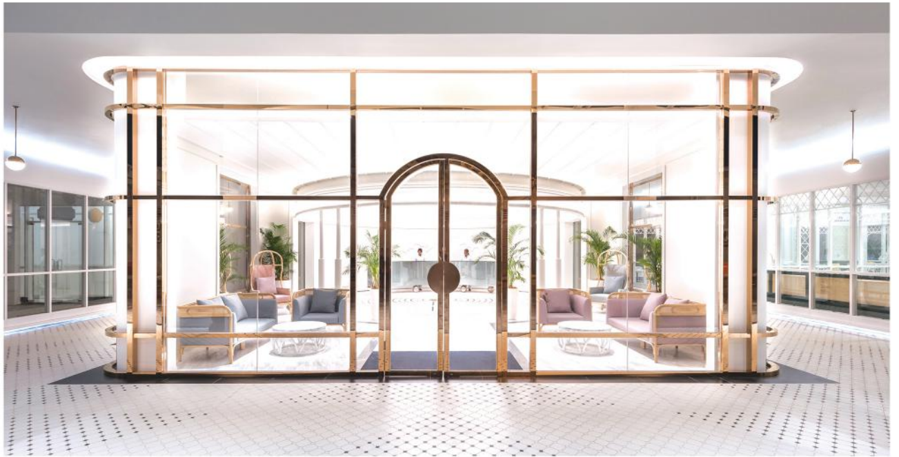
设计师创新地采用店中店概念，将底楼的大厅、玻璃屋餐厅及商业店面规划成独立的空间。

Q 随着“贴近自然环境”的意识逐渐增强，越来越多人渴望与自然环境相处，或是将自然带入室内。您如何看待这样的趋势？请谈谈您在这个项目中所设计的玻璃屋（The Glasshouse）概念。您是如何拿捏室内与室外景观的“分量”？