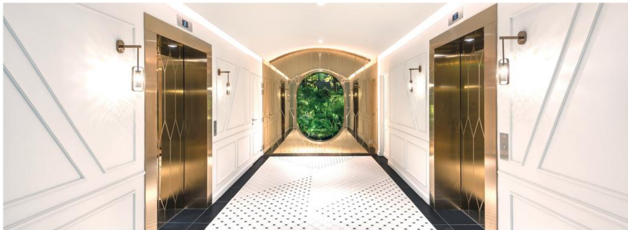
电梯大厅利用大型窗框摄取绿植，形成匠心独具的框景效果。