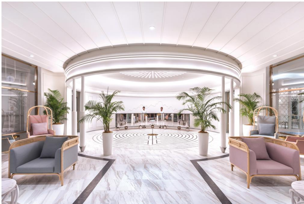
接待台的凹型镜面创造出扭曲的反射效果，看起来像由镀铬球体支撑。

槟城乔治市是大马引以为傲的世界文化遗产之地。坐落在乔治市古迹区的The Prestige酒店，以周围古老而精致的19世纪英殖民建筑样式为灵感，融合传统和现代特征，并以槟城的热带特色为背景，诠释出别具一格的维多利亚建筑风格。建筑师更是妙借电影《致命魔术》的魔法概念，大玩漂浮、隐藏、消失、多重空间的错视效果，为这座包含162间客房、玻璃屋餐厅、活动凉亭、屋顶无边际泳池等设施的酒店，创造出一系列神秘、奇幻又充满惊喜的空间体验。