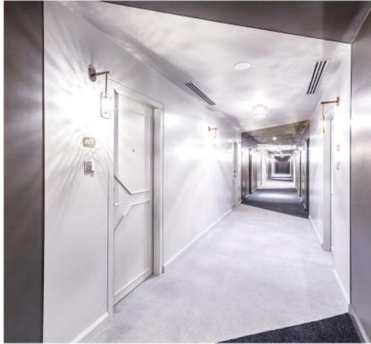
客房走廊使用了明暗交替的配色手法，搭配旋转式影射灯具，为走廊增添动态美感。