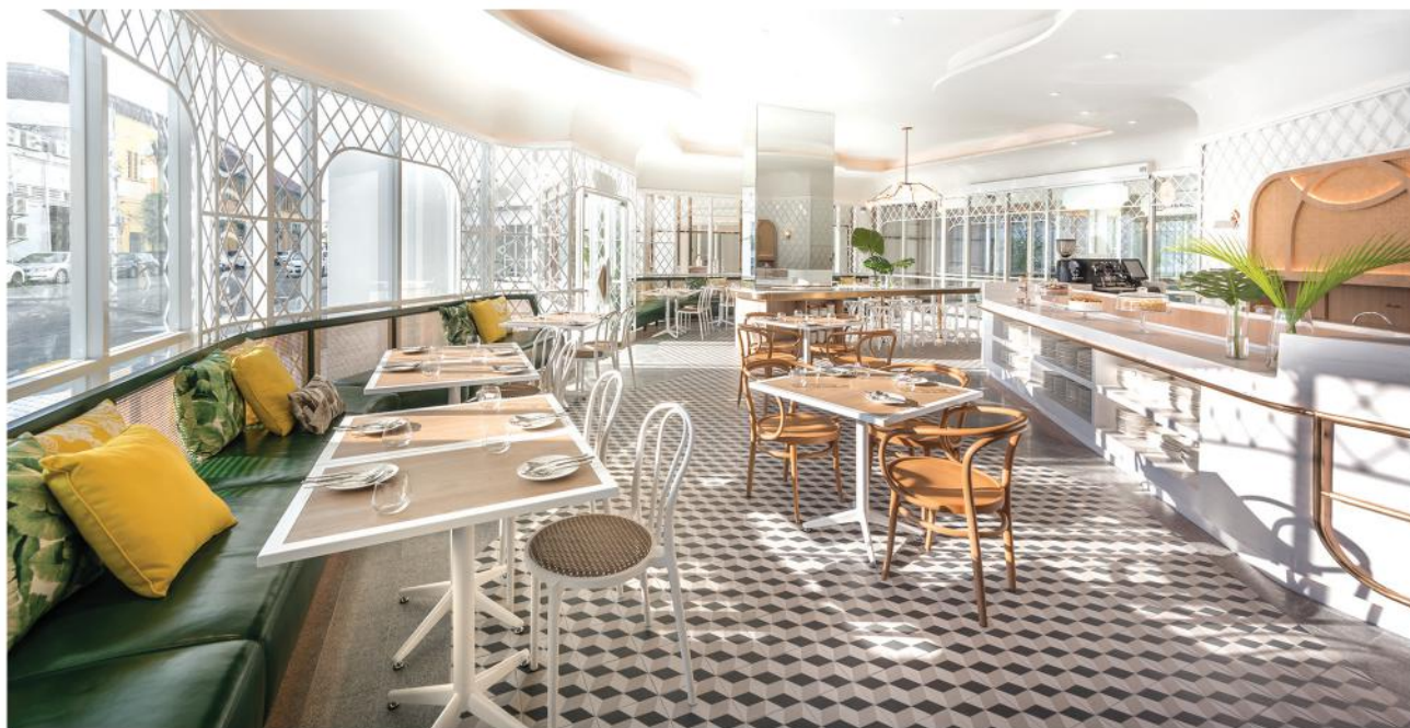
玻璃屋餐厅的设计概念源自维多利亚时代的花园温室，宛如一座“热带伊甸园”。

Q 您在设计中巧妙地运用视觉诡计创造惊喜，并融入了魔术与错觉概念，例如“烟雾与镜子”、黑白地板图案等等，形成有趣的错视效果。请问这些设计的用意为何？请与我们分享您在结合功能和建筑美学时，背后有着怎样的设计原理？