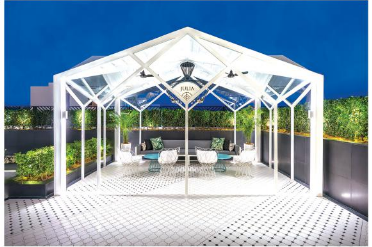
屋顶的活动凉亭，为客人提供一个充满热带风情的休憩小天地。