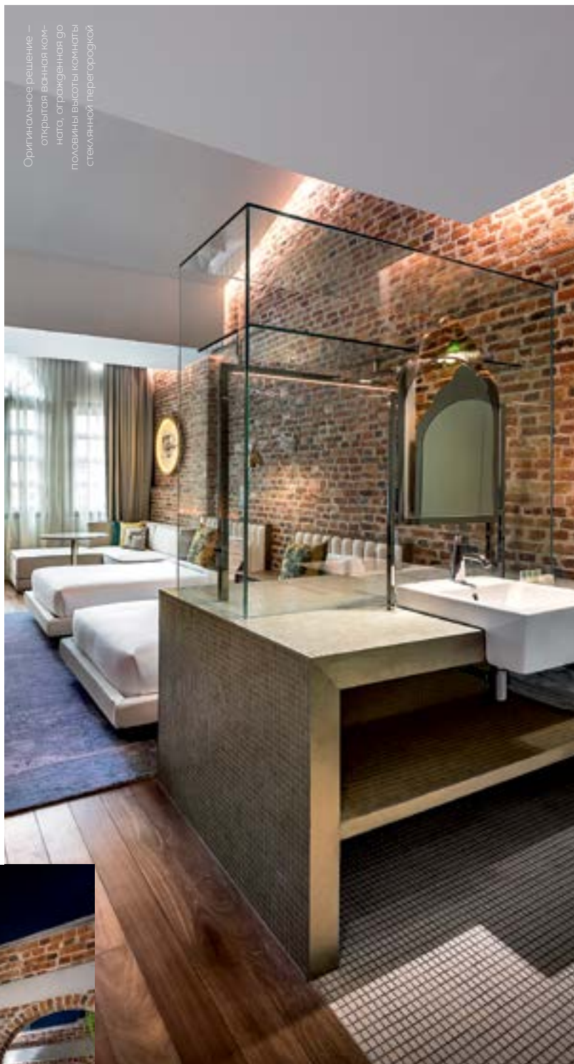
Оригинальное решение — открытая ванная комната, огражденная до половины высоты комнаты стеклянной перегородкой