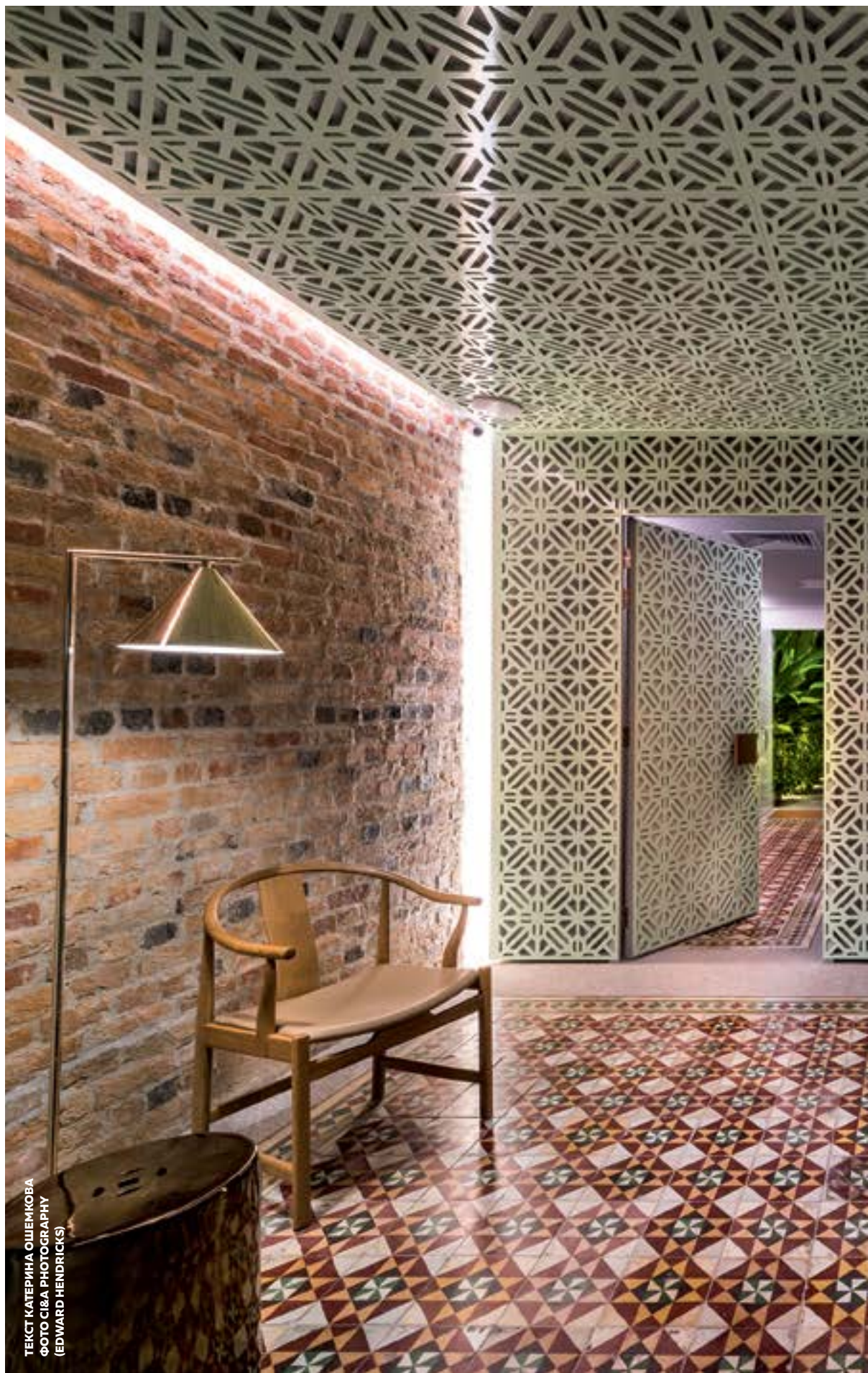
ТЕКСТ КАТЕРИНА ОШЕМИКОВА

Сингапурские дизайнеры Ministry of Design приехали в Малайзию, чтобы переосмыслить ее историю