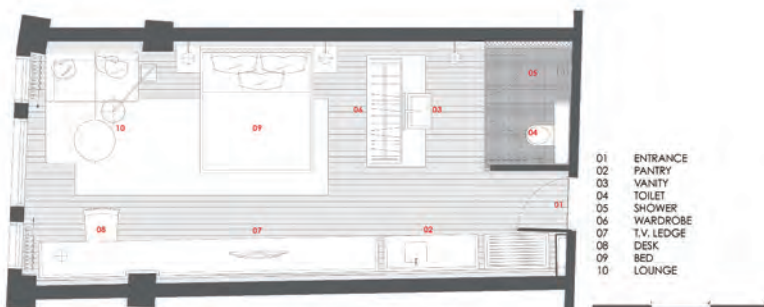
LTK TYPICAL ROOM PLAN

6, 7 객실은 전통적인 소재와 현대적인 설비의 조화를 통해 지역 특유의 이국적이고 독특한 분위기를 즐기며 편안한 휴식의 시간을 누릴 수 있도록 꾸몄다.