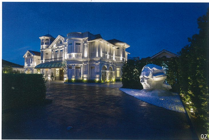
01 ห้องรับประทานอาหารค่ำที่ให้อารมณ์เหมือนอยู่ในเทพนิยาย ภายในตกแต่งด้วยประติมากรรมสัตว์ 02 บริเวณด้านหน้าโรงแรมเป็นที่ตั้งของงานประติมากรรมรูปท่าน Sir Norman Macalister 03-05 บรรยากาศภายในห้องพัก บาร์ และห้องนั่งเล่น

ปิ่น — การปรับปรุงคุณภาพของตระกูล Macalister ให้กลายเป็นบูติคโฮเทลขนาด 8 ห้อง โดยทีมออกแบบจาก Ministry of Design โครงการนี้เป็นภารกิจที่ท้าทายในชีวิต พร้อมๆ กับความพยายามที่จะถ่ายทอดเรื่องราวในเชิงประวัติศาสตร์ผ่านทางรูปลักษณ์อันร่วมสมัยของตัวอาคาร