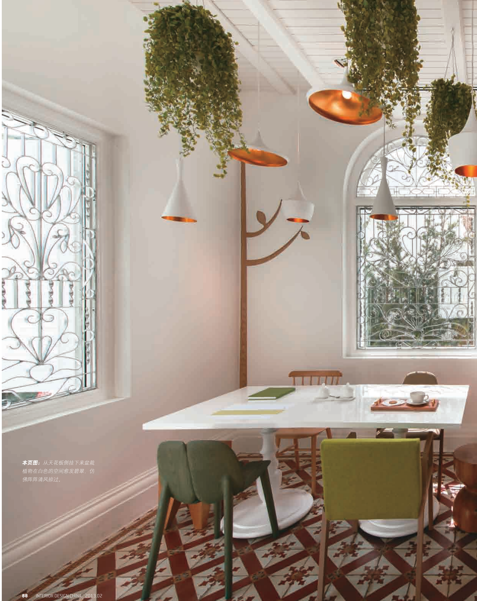
本页图：从天花板倒挂下来盆栽植物在白色的空间愈发碧翠，仿佛阵阵清风掠过。