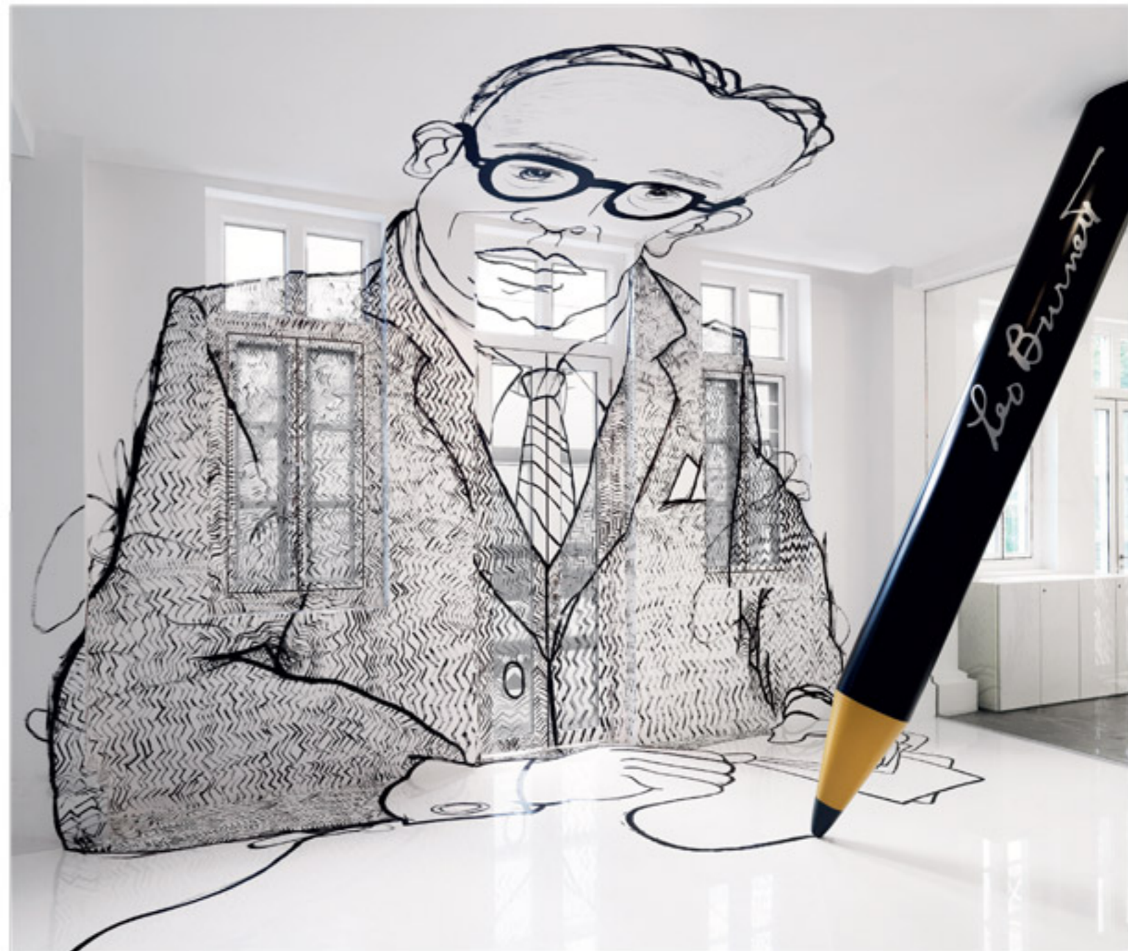
本页：摄影 Edward Hendricks (CISA Photography) 对页：摄影 Jeroen Musch