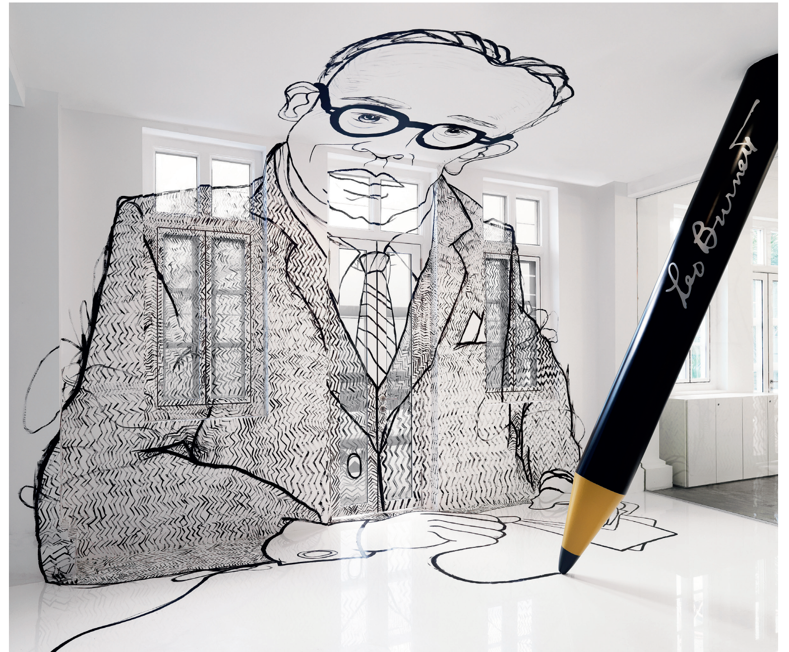
本页：摄影/Edward Hendricks (C&A Photography) 对页：摄影/Jeroen Musch

梦 境中超越现实的场景，一旦被设计师截获，就成了超现实设计的灵感源泉：大理石外观的沙发柔软度出人意料的好，时间停滞不前让快要掉地的椅子悬在半空，一张艳唇沙发带来强烈的感官冲击。扭曲的元素、荒诞的组合创造出梦境的效果，让超现实设计总能带来出其不意的惊喜。