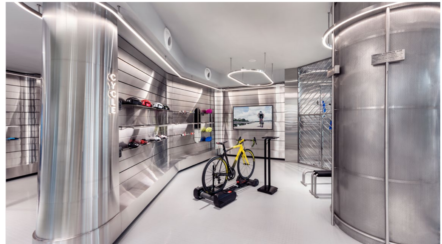
▲ 在“Nero Elite互动装置 (Nero Elite Interactive)” 的自行车训练带上, 顾客们可以体验这个价值30,000新元的Dassi自行车, 值得一提的是, 这个互动装置, 也是新加坡的首例。