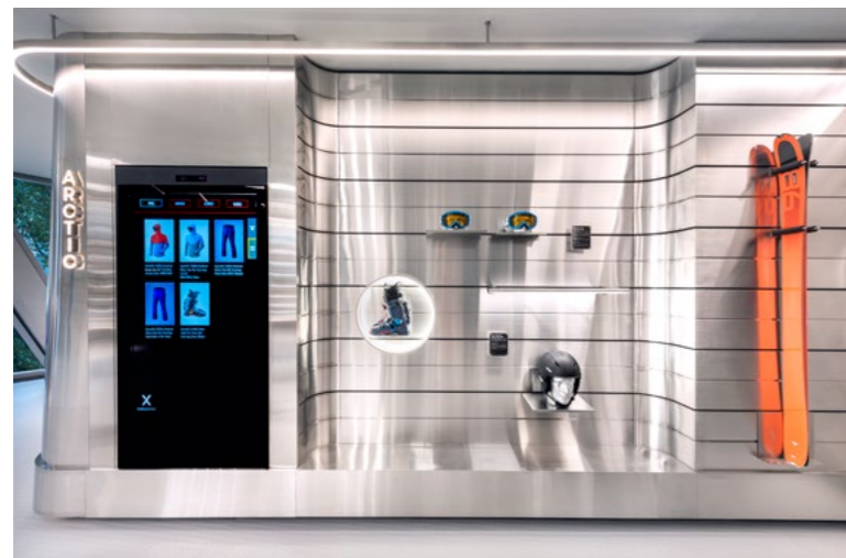
◀ “魔镜 (Magic Mirror)” 是Durasport运动商店中的一个特色, 体验者不用亲自穿上滑雪服, 只需直接站在镜面装置前, 便可以进行“试穿”, 还可以通过电子邮件将“试穿”的照片发送给自己。