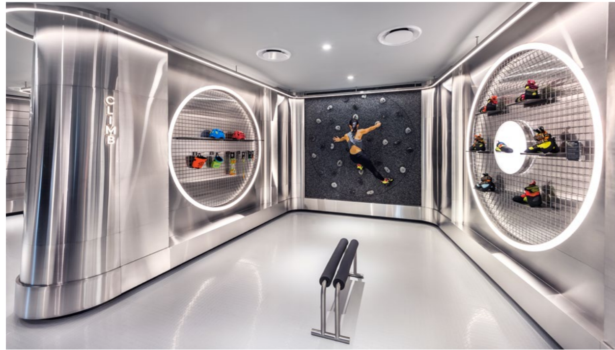
▲ “自由登山者 (Freedom Climber)” 是一个室内互动性非机动攀岩墙, 也是新加坡的首例, 该体验装置带有可旋转表面, 体验者只需穿上登山鞋, 就可以在没有任何高度危险的情况下感受到登山的乐趣。