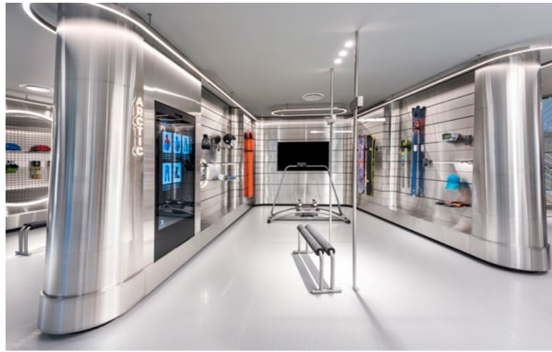
◀ “360°全景滑雪体验器 (Pro Ski 360 Simulator)” 模拟器装置是新加坡的首个能够使体验者完全身临其境的滑雪模拟器, 该装置设有虚拟的下坡滑道 (Downhill)、自由滑道 (Freeride) 和平行障碍滑道 (Slalom) 等选项, 体验者可自行选择, 穿上Dynafit滑雪靴, 体验者便可以开始体验之旅, 看看自己是否能够打破记录。