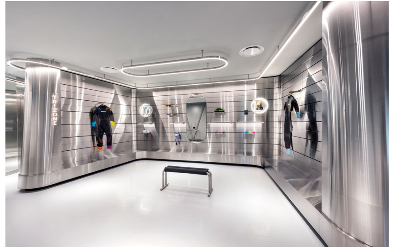
▲ 在“Vasa游泳体验仪 (Vasa Swim Trainer Pro)” 的训练台上, 顾客们不仅可以对Zone3品牌的防寒泳衣进行实景体验和测试, 还能够大秀一把自己矫健的泳姿和过硬的技术。